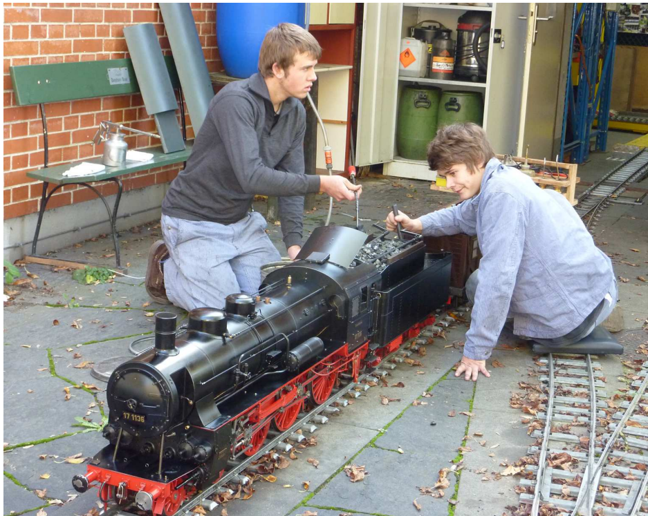
Auch die Dampfloks wurden gereinigt und für den Winterschlaf vorbereitet.