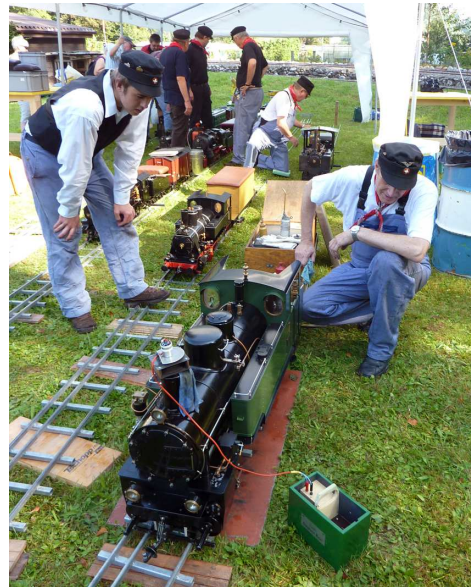
Die Loks konnten in einem speziell für dieses Fest aufgebauten Betriebswerk angeheizt werden.